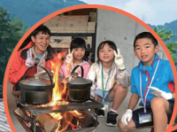
アウトドア クッキング