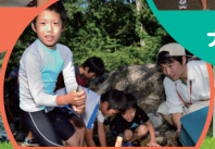
食材調達 ウォーク