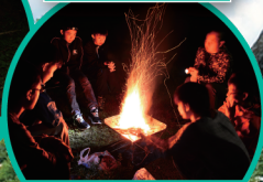
キャンプ ファイヤー